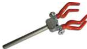
PI-120-QD Quatro Dedos