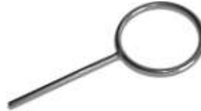
Para Tela Amianto