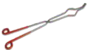
Tesoura em Inox Para Cadinhos