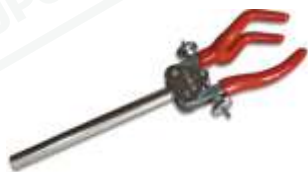
PI-110-TD Três Dedos