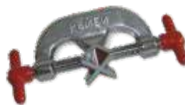
PI-100-UN Universal (Mufa ou Garra)