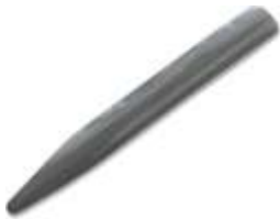
Meia Cana ES-150-MC