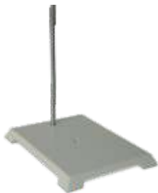
Universal Para Hastes (ferro Fundido)