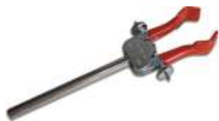
PI-100-DB Dois Braços

Construídas em Aço Inox e Alumínio, com garras revestidas com borracha de PVC.