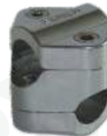
CR-100-CR Castanha (Cruzeta)