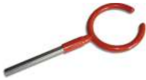
Para Funil Aberto