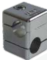
CR-101-CR Castanha (Cruzeta)