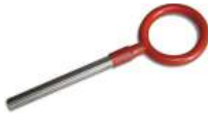
Para Funil Fechado